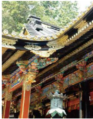
Kunozan Toshogu Shrine / 久能山東照宮