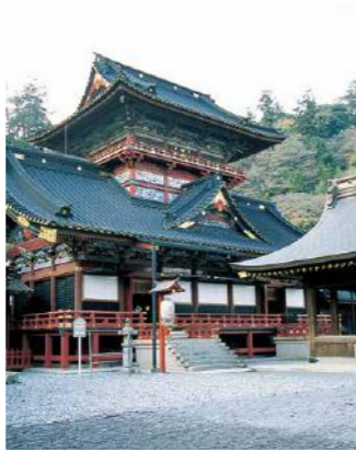
Sengen Shrine / 浅間神社